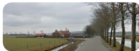
de 1e Weteringsewal in Elst