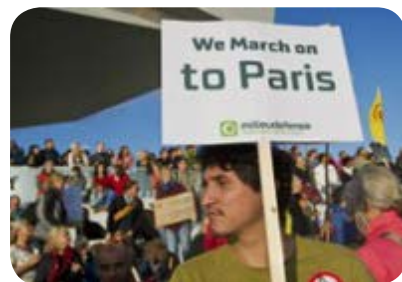
Klimaatwandeling naar Parijs

vloer overschrijden, geen boetes uitschrijft, maar de normen versoepelt. Volgens GroenLinks negeert het College hiermee de urgentie van het klimaatprobleem, dat vraagt om snelle en drastische maatregelen. Kansen zijn er genoeg: de Betuwse Energie Coöperatie wil grootschalige energieprojecten opzetten; woningcorporaties willen hun huizen isoleren; ondernemers staan in de rij om huizen te isoleren en duurzame energie op te wekken; nu een euro investeren om