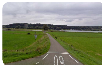
Drielse veer bij Driel