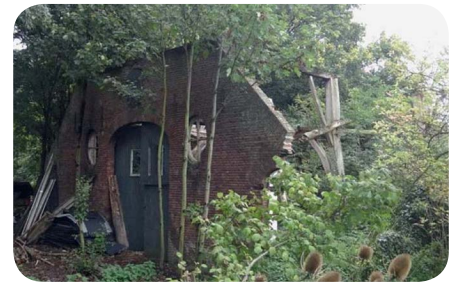
Ingestorte schuur van Boerderij Rijzenburg

in zijn geheel behouden moeten blijven. Bovendien mag pandjesbazen niet de ruimte worden gegeven om de monumenten aan te kopen met als doel deze te slopen en te vervangen door appartementencomplexen.