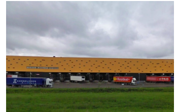
Het Kruidvat in Heteren: een doorn in het oog.

GroenLinks ziet het liefst het hele industrieterrein groen ingepakt, zodat ook de prachtige weidse omgeving in het noorden en oosten weer gevrijwaard wordt van Randstedelijk uitzicht. Het college laat hier echter het belang van grote bedrijven als het Kruidvat prevaleren boven het belang van zijn eigen inwoners, die graag mooie poldergezichten willen in plaats van een 30 meter hoge reclamemast en een muur van industrieblik.