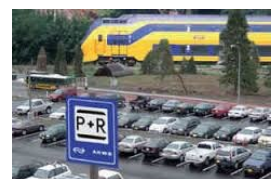
P&R in Rotterdam

WMO/AWBZ. De verantwoordelijkheid voor jeugdzorg en de zorg voor ouderen, zieken en gehandicapten komt op 1 januari 2015 in handen van de gemeente te liggen. De gemeenteraad moet over de invulling van deze zorg beslissen en heeft tot nu toe te weinig vat hierop. GroenLinks is het eens met de conclusies van de Rekenkamer en wil hier graag handen en voeten aan geven.