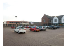
Het Dorpsplein in Herveld. Hier ergens zou het MFC moeten komen.

teerbaar en had graag gezien dat de prioriteiten op duurzaam en sociaal vlak hadden gelegen. CDA, D66, VVD, CU en BBO vonden de begroting echter afdoende en hebben voor gestemd.