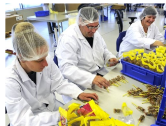
Beschermd werk vanuit Presikhaaf Bedrijven

bijvoorbeeld bij aan- of verkoop van grond. Dit standpunt zal GroenLinks ook op 9 december verkondigen. Waar mogelijk zal GroenLinks pleiten voor behandeling in de openbaarheid