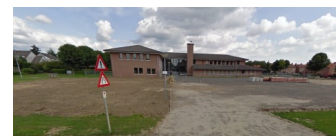
Brede School de Vogeltuyn (in aanbouw)